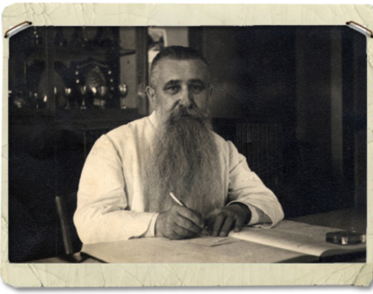
เจษฎาจารย์ ฟ.ซีแลร์

ในปี ค.ศ.1877 (พ.ศ.2420) บาทหลวงเอมิล ออกัสต์ กอลมเบต์ บาทหลวงคณะมิชชันนารีต่างประเทศแห่งกรุงปารีส ได้รับตำแหน่งเป็นอธิการโบสถ์อัสสัมชัญ ด้วยอุดมการณ์อันมั่นคงของท่านที่อยากจะให้วิชาความรู้แก่เด็กชาวสยาม เพื่อเป็นวิทยาทานและด้วยความเมตตาธรรม ท่านได้รับเด็กกำพร้าเข้าไว้ในความดูแลของท่านสืบกว่าคน เพื่อให้เด็กเหล่านั้นได้เรียนวิชา ไว้เป็นกำลังของครอบครัวและประเทศชาติ