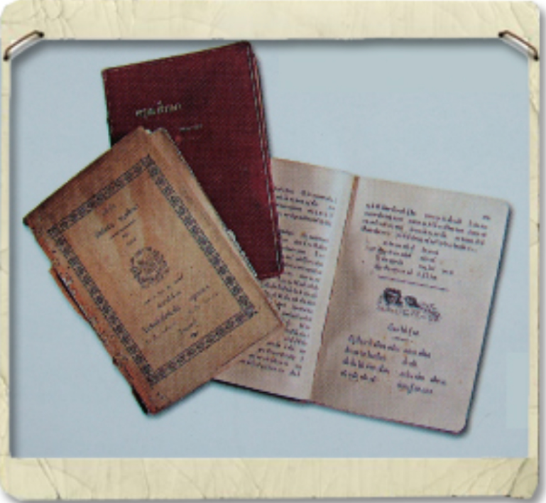
หนังสือตรูมศึกษา

ได้มาถึงกรุงเทพฯ โดยทางเรือแต่ละท่านต้องฝึกฝนภาษาไทยให้ชำนาญ โดยเฉพาะเจษฎาจารย์ ฟรังซัว ซีแลร์ ท่านได้มีมานะจนเรียนได้อย่างแตกฉานและเขียนหนังสือให้เด็กไทยได้เรียนภาษาไทยด้วย คือ หนังสือตรูมศึกษา